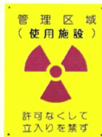
写真②管理区域 (使用施設)標識